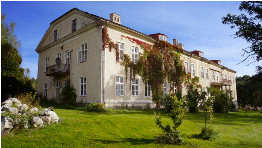
Lindsbergs kursgård, www.lindsberg.org