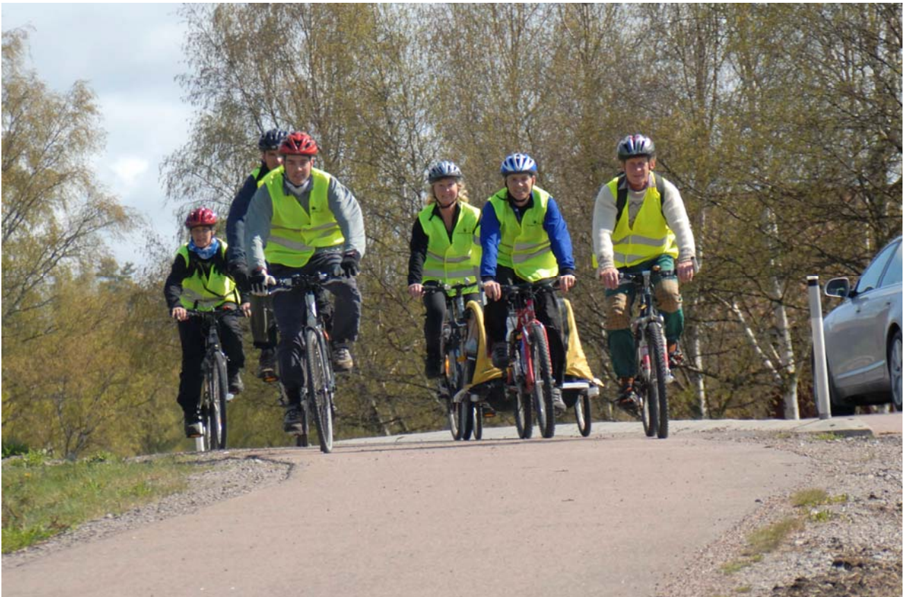
Klimatbudkavlen på väg från Falun till Borlänge